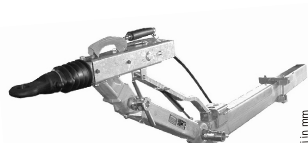
Alegerea lungimii barei KHA freitragende Deichsellaenge KHA